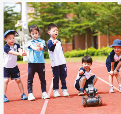
激励创新 · 培育领袖