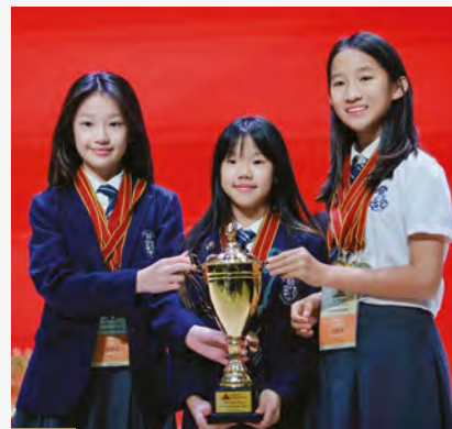
终生学习 · 开源共享