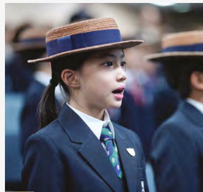
追求卓越 · 开创未来