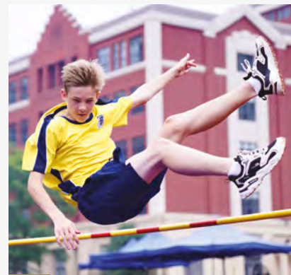
全人教育 · 激发潜能