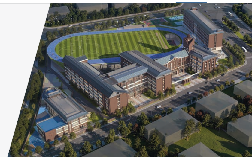
*此图片为计算机生成的效果图，仅供参考。

作为省会城市，广州是广东省的政治、经济、科技、教育和文化中心，占地面积约 7,434 平方公里。广州位于珠江三角洲北缘，是华南地区的核心城市，也是重要的交通和通讯枢纽。