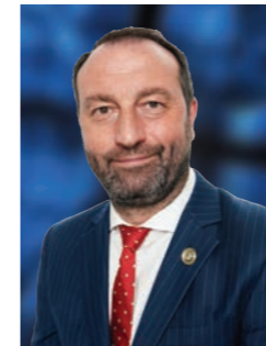
何迈德博士 首席教育官